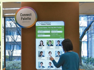
▲出会い検索システム [Connect Palette]