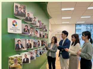
▲起業家紹介スペース [Innovators]