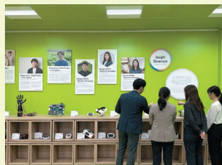
▲技術 PR スペース [Insight Showcase]